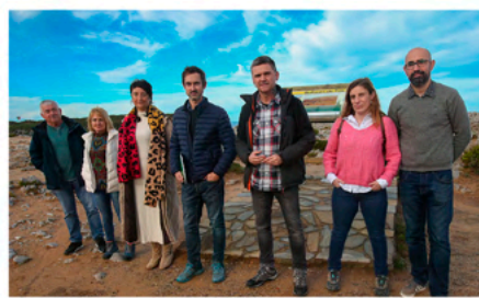
Miembros de Podemos Llanes con el diputado Rafael Palacios, en los Bufones

Logramos incluir una partida de 15.000€, en los Presupuestos autonómicos de 2023, para la mejora de la señalización y seguridad en el entorno de los Bufones de Pría.