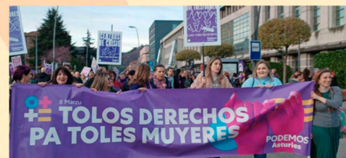
Manifestación del 8 de marzo en Mieres