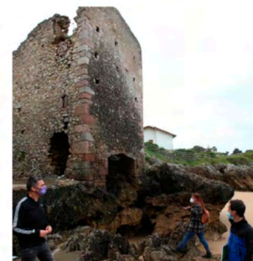
Visita a la Torre de las Cámaras, en Celoriu

Desde 2021 llevamos a cabo diferentes iniciativas cuyo resultado fue el anuncio, por parte de la Consejería de Cultura, de la inclusión de la Torre de las Cámaras en el Inventario del Patrimonio Cultural de Asturias (IPCA), así como la reactivación del proyecto para su rehabilitación, de próxima ejecución.